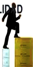
Cuenta de Resultados